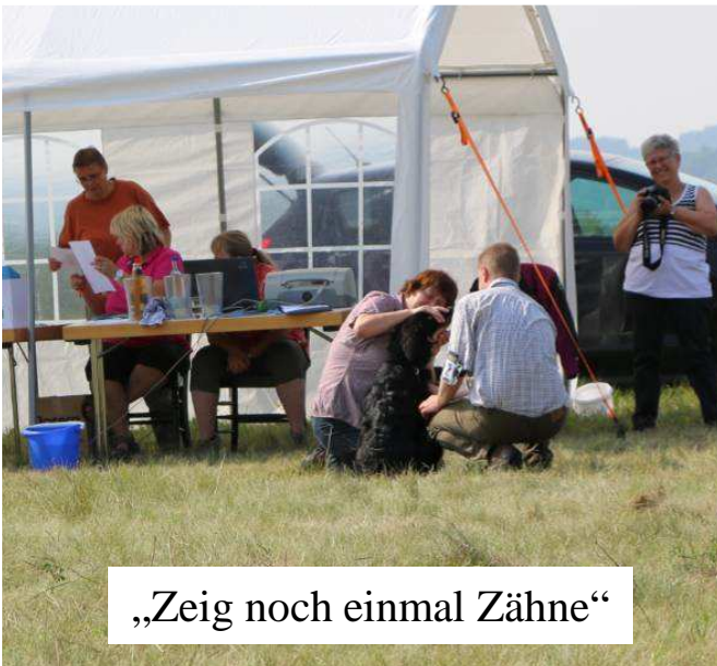
„Zeig noch einmal Zähne“