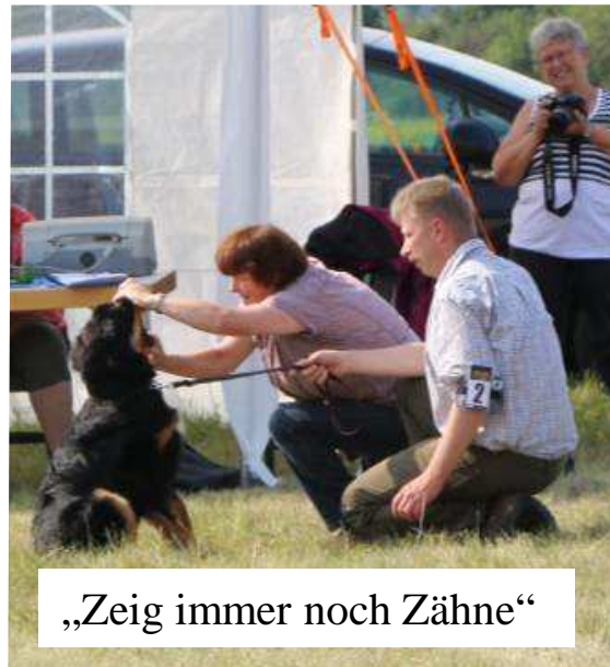
„Zeig immer noch Zähne“