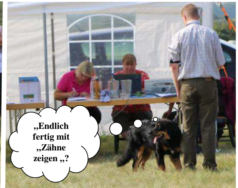
„Endlich fertig mit „Zähne zeigen „?“